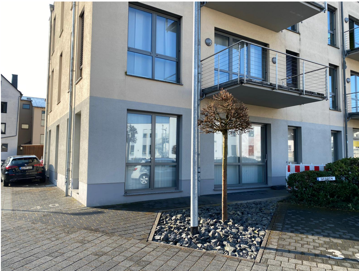
Büro der Glasfaser Montabaur in der Steinstraße 34, 56410 Montabaur